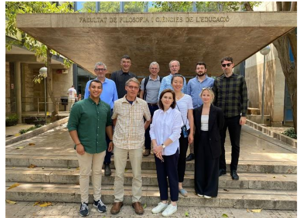
Das RecoVET-Projektteam in Valencia.

Kofinanziert durch das Programm Erasmus+ der Europäischen Union