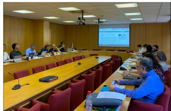
Informationsveranstaltung an der Universität von Valencia.

Eine Informationsveranstaltung an der Universität von Valencia, an der spanische Vertreter*innen der Zielgruppe der Evaluierenden teilnahmen, bildete den Höhepunkt des transnationalen Treffens. Nach einer Präsentation des Projekts fand ein intensiver Meinungsaustausch mit der Zielgruppe statt.